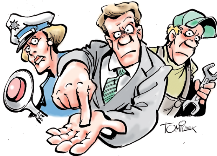
6%, aber dapper! Sonst rußt ed!

Unsere Forderungen, die neben einer sozialen Komponente (Sockel- oder Mindestbeitrag) u. a. auch strukturelle Verbesserungen in der Entgeltordnung sowie allgemeine Einkommensverbesserungen in einem Gesamtvolumen von 6% bei einer