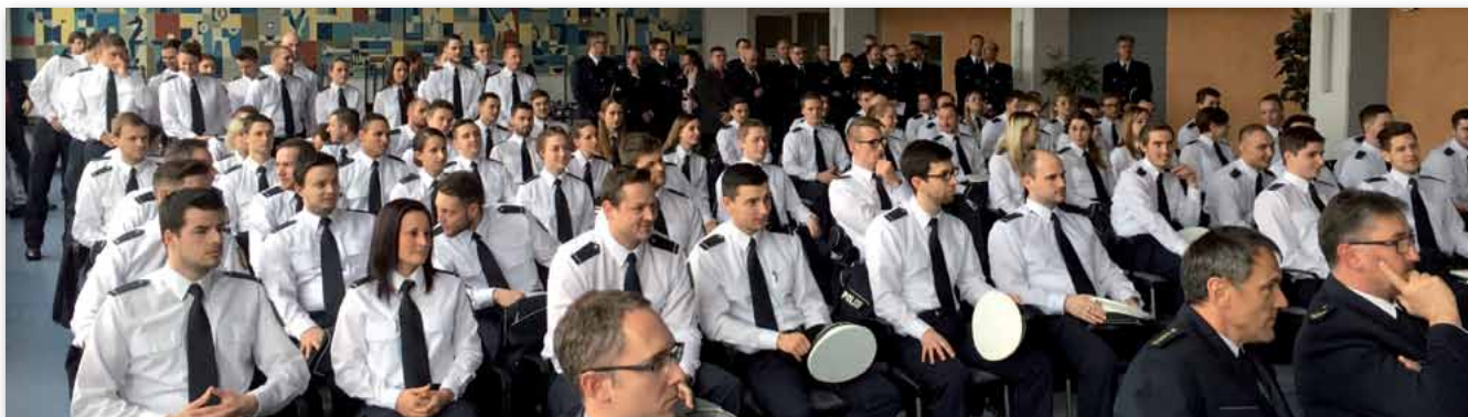
Gut ausgebildete Polizeivollzugsbeamte und Polizeivollzugsbeamtinnen werden in unserer saarländischen Polizei dringend gebraucht. Minister Bouillon (Foto oben) überreichte die Ernennungsurkunden während einer Feierstunde auf dem Wackenberg.