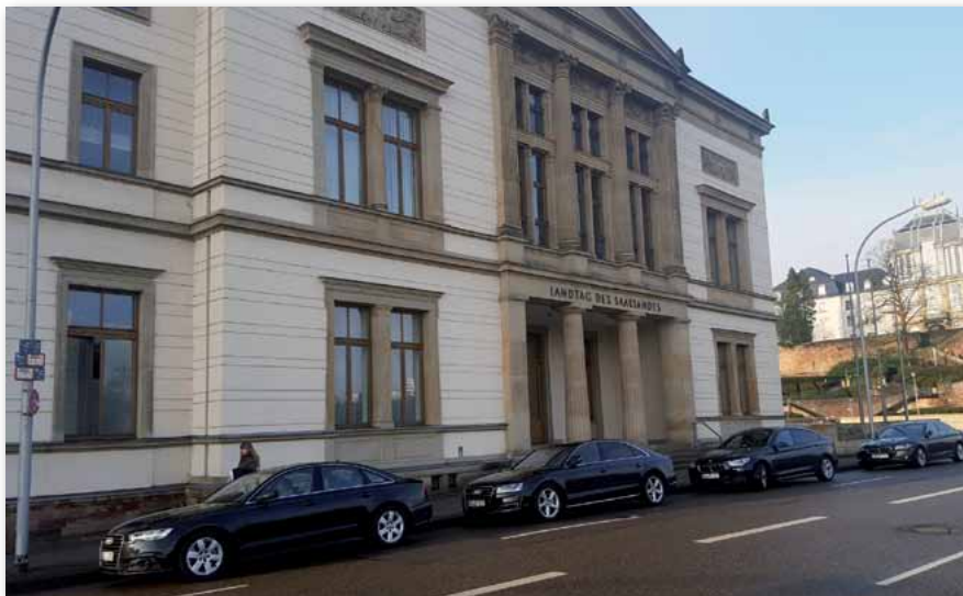
Am 26. März wird der Landtag des Saarlandes neu gewählt. Die Innere Sicherheit wird bei der Wahlentscheidung eine große Rolle spielen.

In den Mitgliederversammlungen der zurückliegenden Monate haben wir eingehend die Themen Beurteilungs- und Beförderungssituation diskutiert. Ausgehend von einem be-