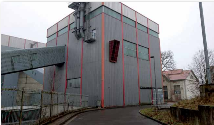
Im Frühjahr 2018 soll es hier in Göttelborn fertig gestellt sein: Das ETZ.

Ende Januar ist die Entscheidung zur Errichtung eines neuen Einsatztrainingszentrums (ETZ) in unmittelbarer Nähe der Fachhochschule in Göttelborn gefallen. Bis zum Frühjahr