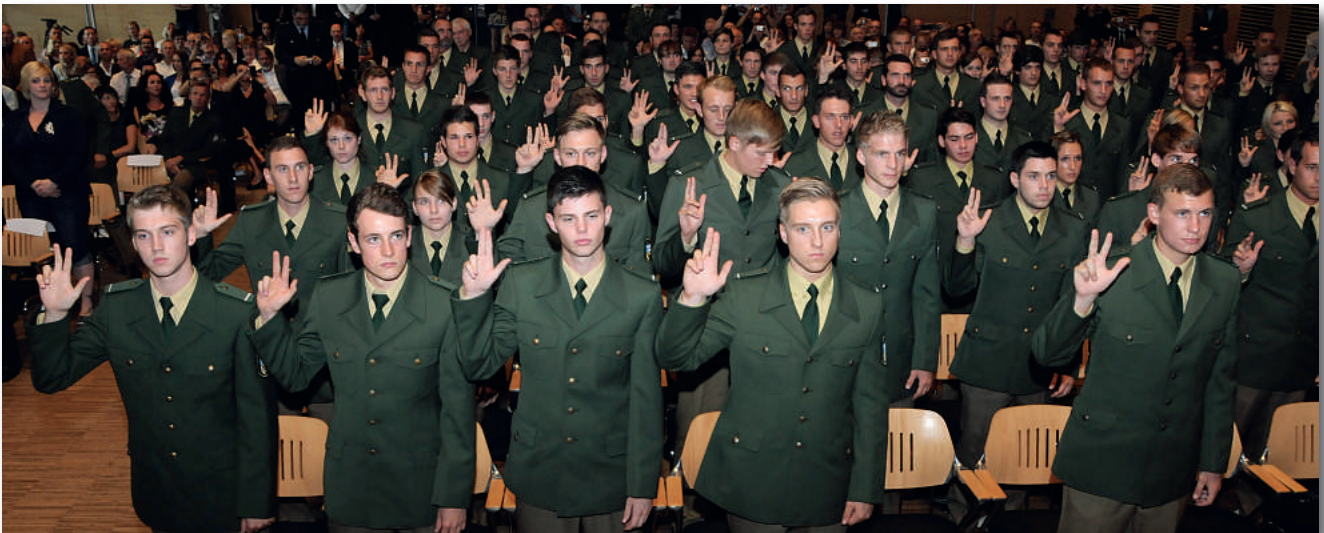
Vereidigung der Anwärtinnen und Anwärter in der Illinger Illipse durch Landespolizeivizepräsident Hugo Müller.

Dienst angetreten haben. Bereits am frühen Morgen des ersten Einstellungstages war die JUNGE GRUPPE mit Unterstützung des GdP-Landesvorstandes und der Frauengruppe wie in jedem Jahr auf den Beinen, um die mit Info-Material und kleinen Willkommensgeschenken bestückten GdP-Taschen zu verteilen.