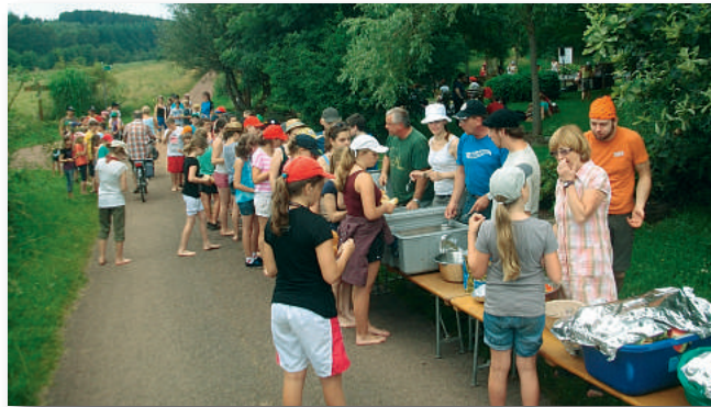
Furage ist auch unterwegs gesichert.

Für die Epoche „Mittelalter“ wurden von den Kindern Ritterrüstungen, Schwerter, Helme und mittelalterliche Gewänder gebastelt. Nach dem Bogenschießen wurde eine große Tafelrunde aufgebaut, und es gab ein leckeres Rittermahl. Die von der Küche vorbereiteten