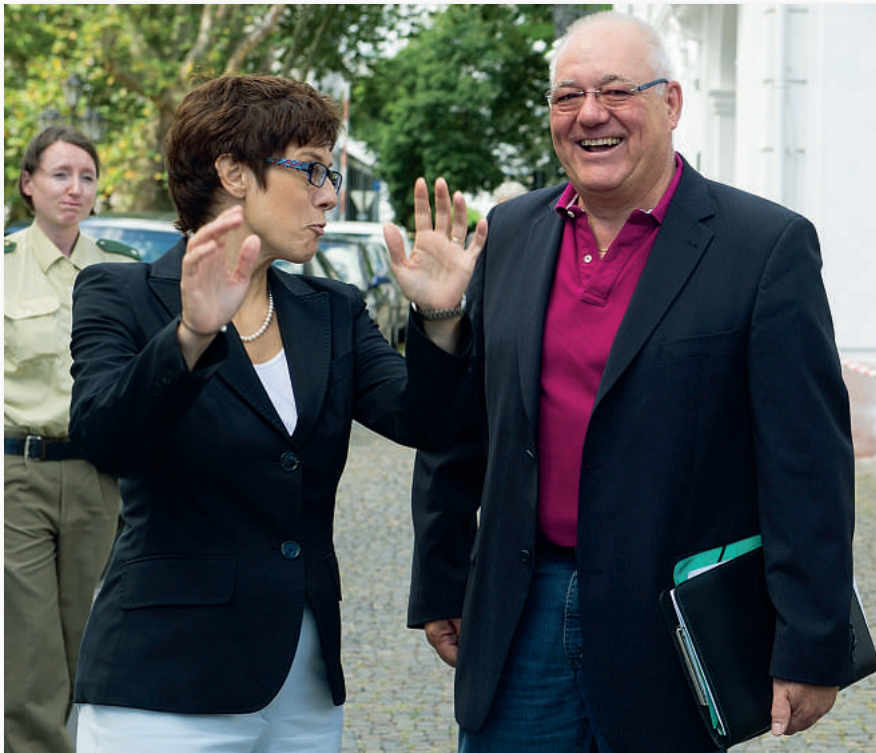
Ministerpräsidentin Annegret Kramp-Karrenbauer im Gespräch mit unserem Vorsitzenden Reinhold Schmitt vor der Staatskanzlei.

Zur Einführung in die Problematik erläuterte die Ministerpräsidentin die Sparzwänge der Landesregierung, die durch die Schuldenbremse und die damit verbundene Kontrollsituation seitens des Stabilitätsrats (des Bundes und der Geberländer) vorgegeben sind. Das Saarland müsse das derzeit strukturelle jährliche