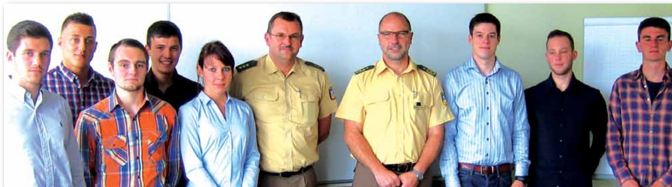
Neu gewählte JAV im Dialog mit der Präsidiumsleitung.

ches Engagement, sich im Interesse ihrer Kolleginnen und Kollegen einzusetzen und starkzumachen. Seitens der JAV wurden dann auch schon erste Themen als Anliegen der Studierenden mit in das Gespräch eingebracht. Über Inhalte und Ergebnisse