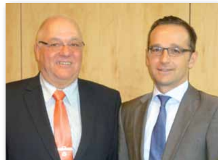
Landesvorsitzender Reinhold Schmitt und stellvertretender Ministerpräsident Heiko Maas am Rande des Spitzengespräches.

4. Zur Besoldungserhöhung und Versorgungsanpassung für die Jahre 2013 und 2014: Eine zeit- und inhalts-