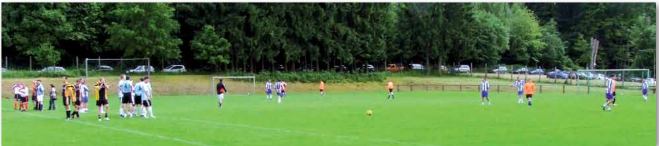
Aufstellen fürs Benefizspiel in der Lakeienschäferei in Neunkirchen.