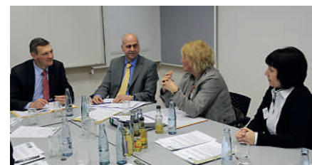
Die Gesprächsrunde im Innenministerium

Als wichtigster Punkt konnte sich die Frauengruppe mit dem Minister darauf verständigen, dass die Vereinbarkeit von Familie und Beruf vor allem im Hinblick auf Schwangerschaft, Elternzeit und Teilzeitarbeit Beachtung in der AG „Polizei 2020“ bzw. der zukünftigen Personalplanung findet – damit der Dienstherr sowohl der einzelnen Person in ihrer familiären Situation als auch den dienstlichen Belangen gerecht werden kann.