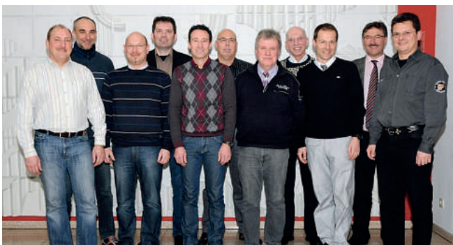
Die Jubilare der Kreisgruppe Landespolizeidirektion