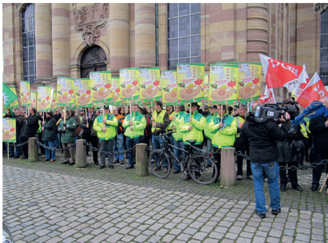
Demo gegen „Sparpaket“ am 17. 11. 2010 vor der Staatskanzlei