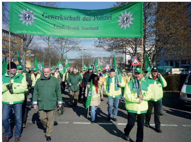
Demo am 28. 2. 2011 quer durch Saarbrücken!