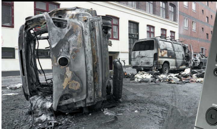
PMD661 Professioneller Feldrecorder