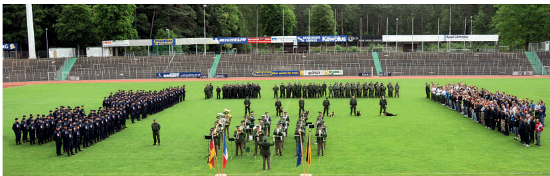
Antreten zur Übung

Zu Beginn der Veranstaltung spielte das Polizeimusikkorps des Saarlandes inmitten der zur Übung angetretenen Polizeikräfte aus Frankreich und Deutsch-