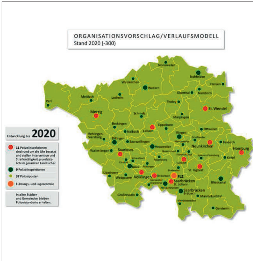
Vorschlag der Arbeitsgruppe: Dienststellenstruktur im Jahre 2020

Redaktionsschluss für die September-Ausgabe 2011 unseres Landesteils ist der 7. August 2011.